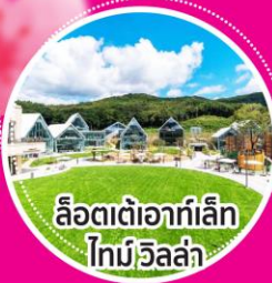
ลือตเต้อาท์เล็ก โทมึอีลล่า