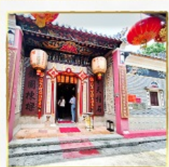
วัดแซกง โฮซุง