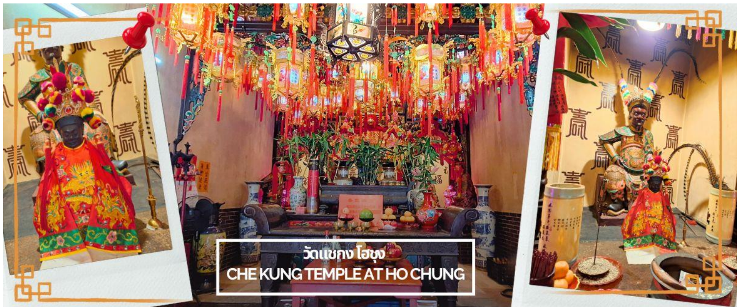
วัดแชกง โฮซุง CHE KUNG TEMPLE AT HO CHUNG

จากนั้นนำทุกท่านเดินทางสู่ วัดแชกง ที่โฮซุง (CHE KUNG TEMPLE AT HO CHUNG) วัดนี้จะมีไม้แกะสลักขององค์แชกง ที่เก่าแก่กว่า 600 ปี เป็นหนึ่งในวัดที่เก่าแก่ที่สุดในฮ่องกง ภายในวัดมีการออกแบบสถาปัตยกรรมแบบดั้งเดิมที่ได้อนุรักษ์ไว้เป็นอย่างดี ตั้งอยู่ริมฝั่งแม่น้ำโฮซุง และห่างจากหมู่บ้านโฮซุง ในเขตไซกุง (SAI KUNG) เพียง 800 เมตร หน้าวัดมีแม่น้ำที่เป็นเส้นทางลัดไปเกาลูน ด้านหลังเป็นภูเขา เป็นวัดที่มีสงฆ์ที่ดี คนท้องถิ่นนิยมมาไหว้ขอพรเกี่ยวกับธุรกิจการค้า รวมถึงเรื่องโชคลาภที่วัดแห่งนี้ด้วย ถือได้ว่าเป็นอีกวัดหนึ่งที่ไม่ควรพลาดจากตำนานที่เล่าสืบกันมาในอดีตเขตไซกุง (SAI KUNG) ได้มีโรคระบาดเกิดขึ้น รักษาไม่หาย ทำให้ผู้คนล้มตายเป็นจำนวนมาก ชาวบ้านแถบนั้นจึงได้มากราบไหว้ขอพรจากองค์แชกงที่ตั้งอยู่หมู่บ้านโฮซุงแห่งนี้ หลังจากนั้นโรคระบาดก็ได้หายไปราวกับปาฏิหาริย์ จึงเป็นที่รำลึกถึงความศักดิ์สิทธิ์ขององค์แชกงสืบกันมา ต่อมาได้เกิดโรคระบาดที่เขตซาถิ้น (SHA TIN) หาทางรักษาอย่างไรก็ไม่หาย ชาวบ้านแถบนั้นจึงได้มาขอยืมองค์แชกงที่อยู่วัดโฮซุงแห่งนี้ ไปตั้งไว้ที่วัดในเขตซาถิ้น ให้ชาวบ้านกราบไหว้ ซึ่งไม่นานโรคระบาดก็ได้หายไป ชาวบ้านที่เขตซาถิ้น จึงได้ขอให้ไม้แกะสลักองค์แชกงที่ยืมมาให้ตั้งอยู่ประจำที่วัดเขตซาถิ้นเลย แต่ชาวบ้านที่โฮซุงไม่ยอม จึงแกะสลักองค์แชกงองค์ใหม่ให้แก่ชาวบ้านที่เขตซาถิ้น จึงเป็นที่มาว่าองค์แชกงที่หมู่บ้านโฮซุงเป็นองค์ดั้งเดิม และเป็นต้นแบบของไม้แกะสลักองค์แชกง ของวัดในเขตซาถิ้นที่นักท่องเที่ยวนิยมไปไหว้ในปัจจุบันนี้อีกด้วย