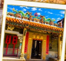
วัดมุกฮุย (วัดปึกไต)