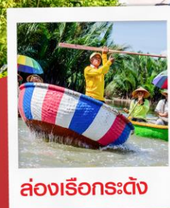
ล่องเรือกระดิง