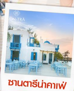
คาเฟ่ริมน้ำกาแฟ

บุฟเฟ่ต์นานาชาติ บนบาน่าฮิลล์ และ บุฟเฟ่ต์ชาบู-ปิ้งย่าง