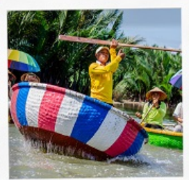
เรือกระดิง