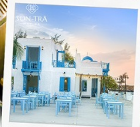
ซานตารีน่าคาเฟ่