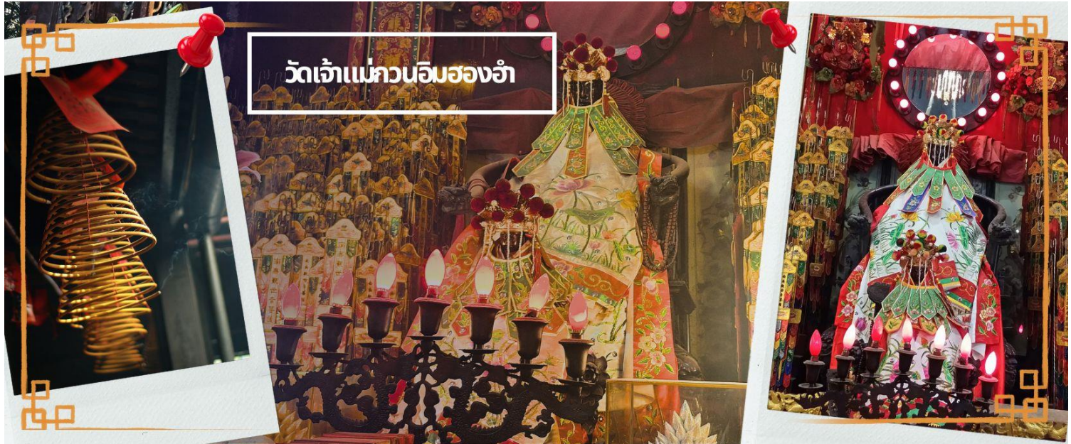
วัดเจ้าแม่ทวนอิมฮ่องอ้า

จากนั้นนำท่านชม โรงงานจิวเวอรี่ ซึ่งเป็นโรงงานที่มีชื่อเสียงที่สุดของฮ่องกงในเรื่องการออกแบบเครื่องประดับ อาทิเช่น จี้ และแหวนกำหั้น ที่สวยงามโดดเด่นไม่เหมือนใคร ซึ่งถือกำเนิดขึ้นที่นี่และมีชื่อเสียงที่สุดใช้เป็นเครื่องประดับติดตัว และเสริมดวงชะตา สินค้าทุกชิ้นมีเอกสารรับประกันคุณภาพเปลี่ยน ซ่อม ใต้ตลอดอายุการใช้งาน หากเกิดการชำรุดจากสินค้าไม่ใช่อุบัติเหตุ และนำท่านเลือกซื้อ เครื่องประดับที่ ร้านหยก ซึ่งคนจีนนั้นถือว่าหยกเป็นหิน ที่เป็นตัวแทนของความสวยงามและความบริสุทธิ์ มีความเชื่อว่าหยกมงคล ถ้าพกติดตัวไว้จะอายุยืนและสุขภาพดี