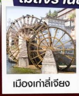
เมืองเก้าลี่เจียง