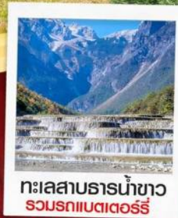
ทะเลสาบธารน้ำขาว รวมรถแบริดเตอร์รี่