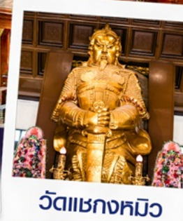
วัดเขากงหมิว