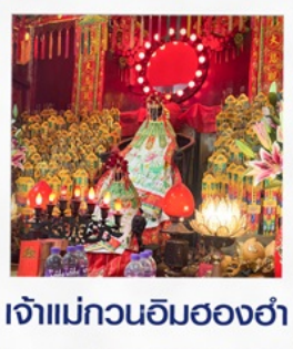
เจ้าแม่กวนอิมสองฮา