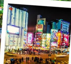
ช้อปปิ้งซีเหมินติง