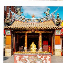
วัดเสี่ยวไท่เจียงหวง