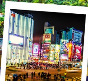
ช้อปปิ้งซีเหมินติง