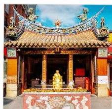
วัดเสียให้เจิ้งหวง

ขอคนรัก วัดเสียให้เจิ้งหวง พักย่านช้อปปิ้งซีเหมินติง ชมทะเลสาบสุริยันจันทรา เมืองโบราณจิวเฟิ่น 4วัน 3คืน