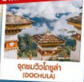
จุดชมวิวดอชูล่า (DOCHULA)