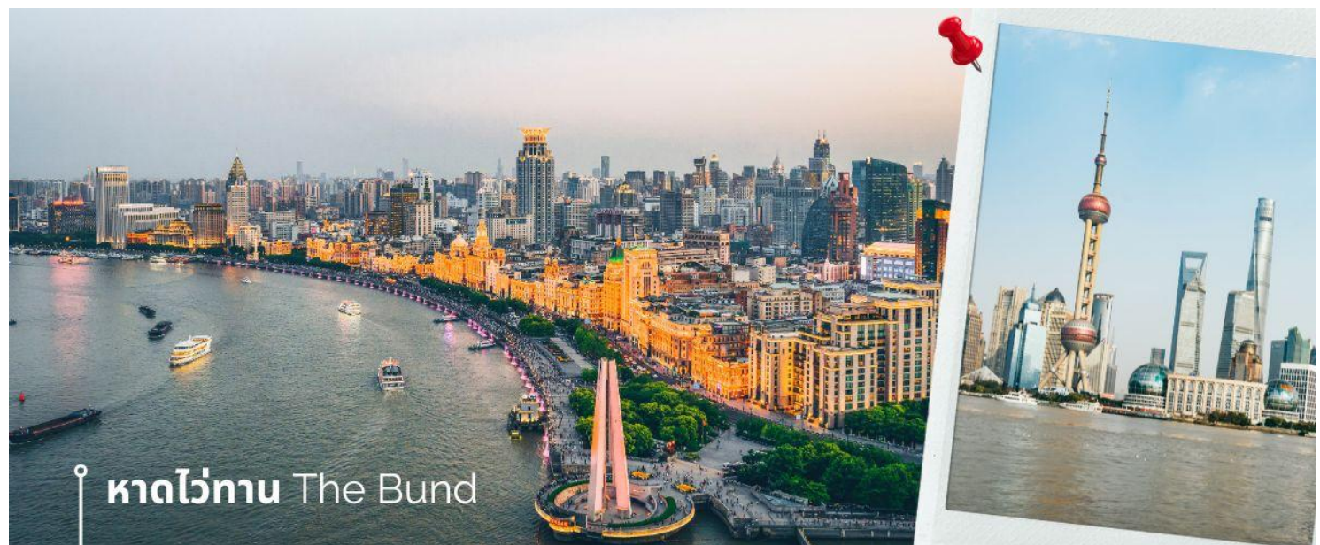
หาดไว่ทาน The Bund

จากนั้นนำท่านเดินทางสู่แลนด์มาร์คของเมืองเชียงใหม่ นักท่องเที่ยวทั้งชาวจีนและชาวต่างชาติ ต่างพากันมาถ่ายรูปอย่างไม่ขาดสาย เมื่อมาถึงเมืองเชียงใหม่ นั่นคือ หอไข่มุกตะวันออก Oriental Pearl Tower (ผ่านชม) เป็นหอส่งสัญญาณวิทยุโทรทัศน์สูง 468 เมตร ลักษณะเป็นไข่มุก 11 ลูก และ เสา 3 เสา ด้านบนเป็นรูปไข่มุก 3 เม็ด 3 ขนาดเรียงกันในแนวตั้ง