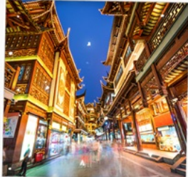
ตลาดเดินหัวงเมี้ยว