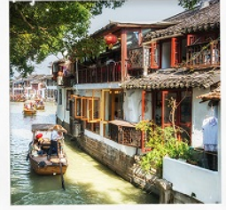
เมืองโบราณจูเจียเจี๋ย