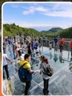
ระเบียงแก้วอุ๋หลง

ภูเขาหว่าอูซาน (รวมขึ้นกระเช้าไป-กลับ) - อุทยานเจานางฟ้า อุทยานหลุมฟ้าสะพานสวรรค์ - ระเบียงแก้วอุ๋หลง - รถไฟฟ้าทะเลตึก หงหยาดัง - วัดเป้ากัว - หลวงพ่อโตเลอซาน - วัดต้าจื่อ หมี่แพนด้ายักษ์ ซุปปิ้ง ถนนคนเดินซุนซู่ ไท่กุหลี่