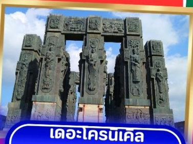
เดอะโครนเคิล ออฟ จอร์เจีย