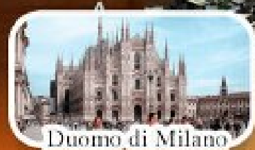
Duomo di Milano