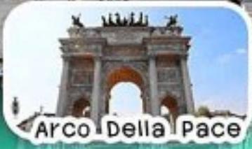
Arco Della Pace