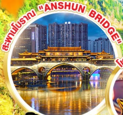
สะพานโบราณ "ANSHUN BRIDGE"