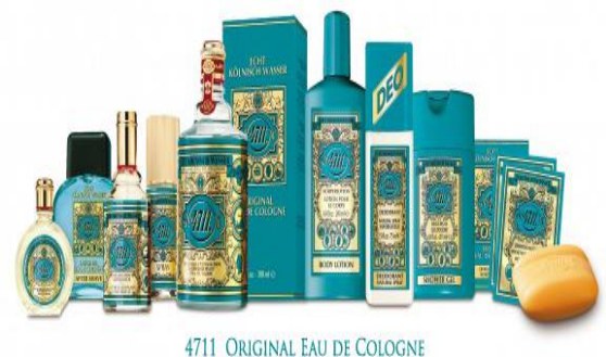
4711 ORIGINAL EAU DE COLOGNE