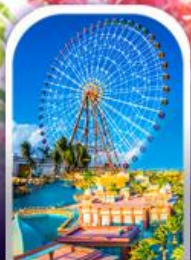
เมืองแฟนตาซี