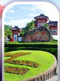
อุทยานหนานซาน

ทางเดินริมชายทะเลซานย่า • ทุ่งดอกกุหลาบอ่าวย่าหลง อุทยานหนานซาน • เทียบบนเกาะดอกไม้ • ทุ่งเกลือพันปี ช้อปปิ้งไนท์มาร์เก็ตถนนโบราณฉีหลอ