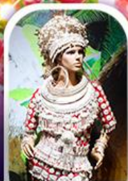
หมู่บ้านชนเผ่า