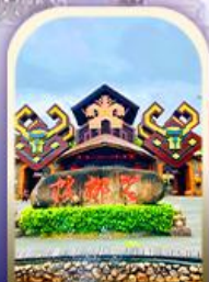
หมู่บ้านชนเผ่า