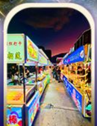
ตลาดอ๊ฮึง