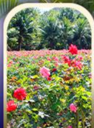
ทุ่งอ่าวย่าหลง