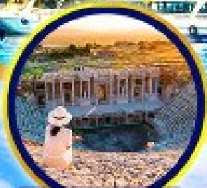
นครเอเฟซัส