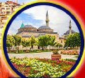
พิพิธภัณฑ์ Hagia Sophia