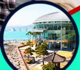
เอเปคเฮาส์ บูริมารู