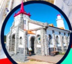
โบสถ์คริสต์จุกซอง