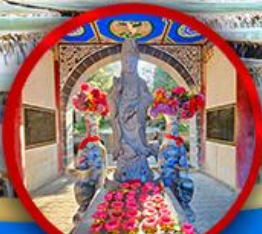
เจ้าแม่กวนอิมต้าลี่