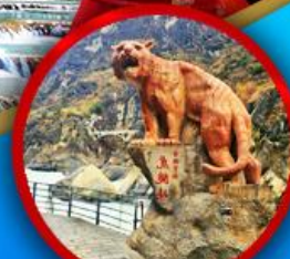
ช่องเขาเสือกระโจน