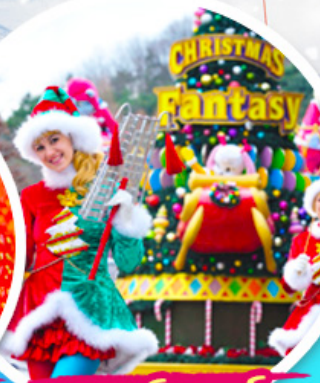
เอเวอร์แลนด์