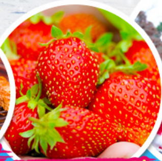
ไร้สตรอว์เบอร์รี่