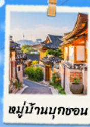
หมู่บ้านมุกซอน