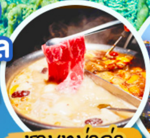
ชาบูหม่าล่า