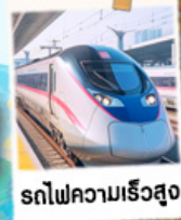
รถไฟความเร็วสูง