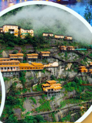
ชมเขาเทวดา