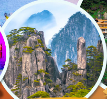
ภูเขาหวงชาน