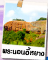
พระนอนอภัย