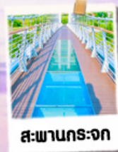
สะพานกระจก