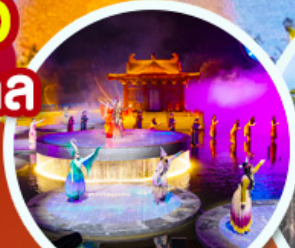
ชมโชว์อุทนีโจว