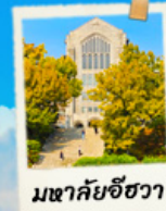
มหาชัยชีวา