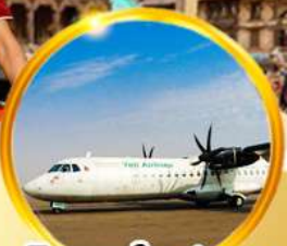
บินภายใน 1 ชม