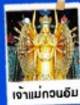
เจ้าแม่กวนอิม