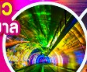
อุโมงค์เลเซอร์