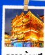
ตลาดร้อยปี