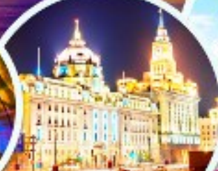
เดอะบันด์