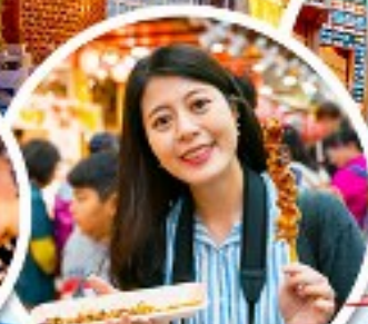
ตลาดควางจง