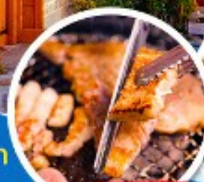
หมู่บ้านเกาหลี