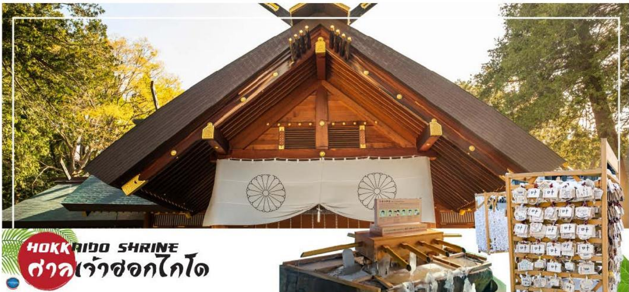
HOKKAIDO SHRINE ศาลเจ้าซอกไกโด

นำท่านเดินทางสู่ เมืองซัปโปโร (SAPPORO) (ใช้เวลาเดินทางประมาณ 2.30 ชั่วโมง) นำท่านขอพร ศาลเจ้าซอกไกโด (Hokkaido Shrine) หรือเดิมชื่อ ศาลเจ้าซัปโปโร เปลี่ยนเพื่อให้สมกับ ความยิ่งใหญ่ของเกาะเมืองซอกไกโด ศาลเจ้าชินโดนี้คอยปกป้องรักษา ให้ชนชาวเกาะซอกไกโดมีความสุขถึงแม้จะไม่ได้มีประวัติศาสตร์อันยาวนาน นำท่านเดินทางสู่ ย่านซุซุกิโนะ (Susukino) นับเป็นย่านที่เต็มไปด้วยแหล่งบันเทิงที่โด่งดังมากที่สุดของเมืองซัปโปโร (Sapporo) อีกทั้งยังเรียกได้ว่าเป็นย่านบันเทิงที่ใหญ่ที่สุดในทางตอนเหนือของญี่ปุ่นทีเดียวล่ะค่ะ บอกเลยว่าอยากมาบันเทิงใจยามค่ำคืนสัมผัสไลฟ์สไตล์แบบคนญี่ปุ่นแท้ๆ ต้องมาที่นี่ให้ได้เลยล่ะค่ะ เพราะเต็มไปด้วยร้านค้า บาร์ ร้านอาหาร ร้านคาราโอเกะ และตู้ปาลังโกะรวมกว่า 4,000 ร้าน บางร้านนี้เปิดจนถึงเที่ยงเที่ยงคืน