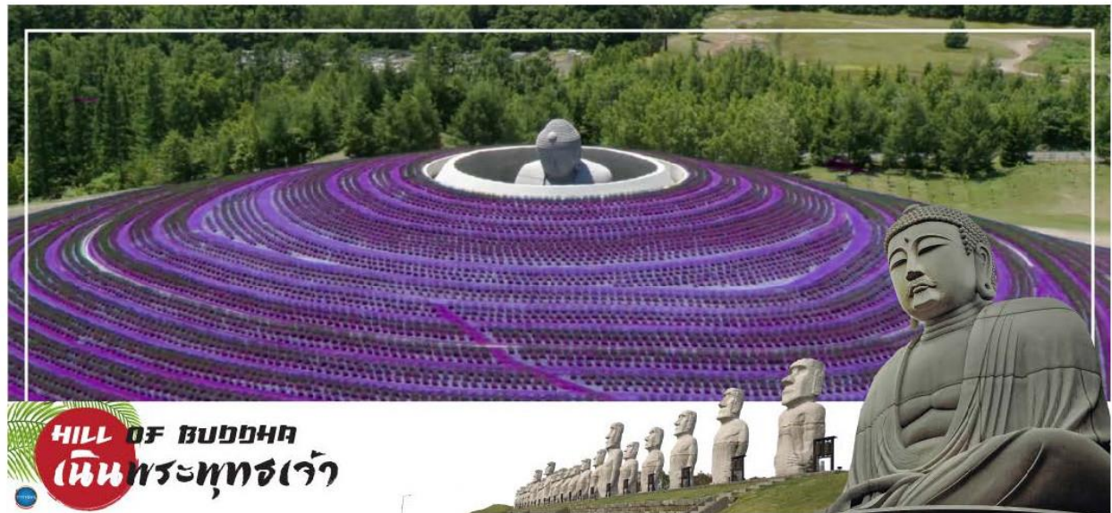
HILL OF BUDDHA เนินพระพุทธเจ้า

01.20 น. ออกเดินทางสู่ ท่าอากาศยานนิวซีโดสะ เกาะฮอกไกโด ณ ประเทศญี่ปุ่น เที่ยวบินที่ XJ620