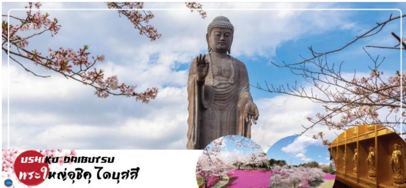
USHIKU DAIBUTSU พระใหญ่อุซึกุ ไดบุตสึ

นำท่านนมัสการ พระใหญ่อุซึกุ ไดบุตสึ (Ushiku Daibutsu) (ใช้เวลาเดินทางประมาณ 50 นาที) เป็นพระพุทธรูปปางยืนที่สูงที่สุดของประเทศญี่ปุ่น และเคยเป็นรูปปั้นที่สูงที่สุดในโลกที่ถูกบันทึกไว้โดยหนังสือบันทึกสถิติโลกกินเนสส์ (Guinness Book of world records) เมื่อปี ค.ศ. 1995 ด้วยจากความสูงถึง 120 เมตร ทำให้สามารถมองเห็นได้ตั้งแต่ใจกลางเมืองโตเกียวเลยทีเดียว สามารถเข้าไปยังบริเวณภายในรูปปั้นและขึ้นไปยังจุดที่เป็นหอสังเกตการณ์ในระดับความสูงที่ 85 เมตร ซึ่งจะอยู่ตรงส่วนของหน้าอกพระพุทธรูป เป็นจุดที่สามารถมองเห็นวิวในมุมด้านกว้างได้ ทั้งหมด บนชั้นนี้จะมีกระจกที่เป็นช่องหน้าต่างอยู่ด้วยกัน 4 ด้าน และมองเห็นภูเขาไฟฟูจิได้จากตรงนี้อีกด้วย (ราคาไม่รวมค่าเข้าพระพุทธรูปด้านใน) บริเวณใกล้เคียงจะมีสวนขนาดใหญ่เนื่องจากต้นไม้ในสวนส่วนมากเป็นต้นซากุระ ในช่วงที่ซากุระบานที่นี่จึงสวยงามเป็นพิเศษ เรียกได้ว่ามาไหว้พระอย่างเดียวก้อิ่มบุญแล้ว แถมยังได้อึ้งใจไปกับวิวสวยๆอีกด้วย (ราคาไม่รวมค่าเข้าชมสวน) นำท่านเดินทางสู่ เมืองนาริตะ (ใช้เวลาเดินทางประมาณ 40 นาที)