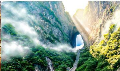
ประตูสวรรค์