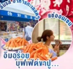
อิมอร้อย บุฟเฟ่ต์งาปู...

📍 ไฮไลท์!! นั่งกระเช้าชมวิวทิวทัศน์ขึ้นภูเขา Omuro (ตามรอยอนิเมะชื่อดัง) ชมซากุระ ณ หมู่บ้านโอชิโนะฮักโกะ วิวภูเขาไฟฟูจิสังวาลค์ติดกับพื้นหลังสีฟ้า เทียว เมืองอาโอยุ จ.อิบารากิ เมืองซายาฮาดะ-เลญี่ปุ่นตะวันออก ช้อปปิ้งใจ ชินจูกุ พร้อมเช็คอิน แลนด์มาร์คแห่งใหม่ แมวยักษ์ 3 มิติ บุฟเฟ่ต์งาปู และผ่อนคลายกับการแช่น้ำแร่ธรรมชาติ (ออนเซน)