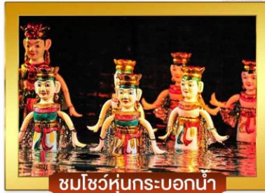
ชมโชว์หุ่นกระบอกน้ำ