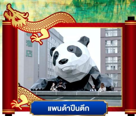
แพนด้าปิ้งคิก