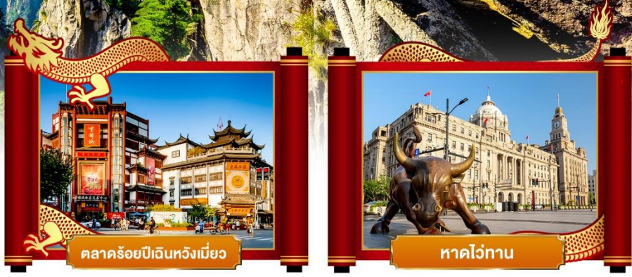
ตลาดร้อยปีฉินหวงเหมียว