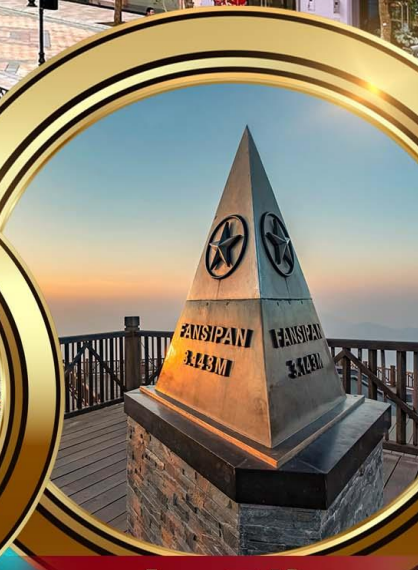
ฟานซีปัน