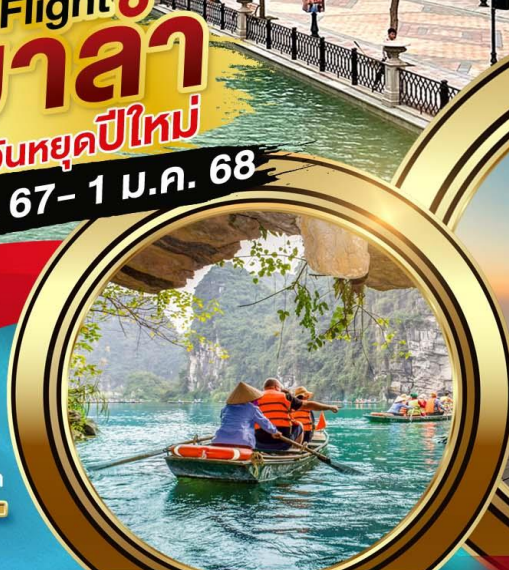
บิ่งห์บิ่งห์