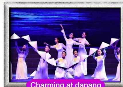
Charming at danang