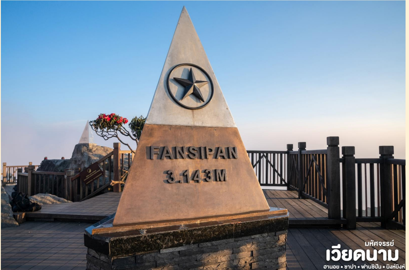
เม็คจอร์ซี่ เวียดนาม ฮานอย • ซาปา • ฟานซิปัน • นิงห์บิ่งห์