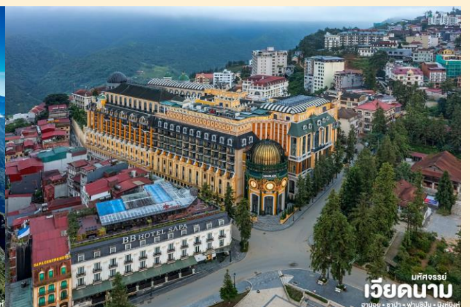
เม็คจอร์ซี่ เวียดนาม ฮานอย • ซาปา • ฟานซิปัน • นิงห์บิ่งห์