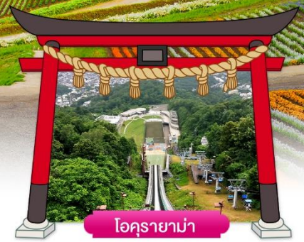
โอคุรายาม่า