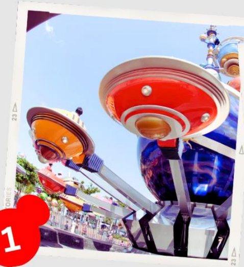
MAIN STREET USA