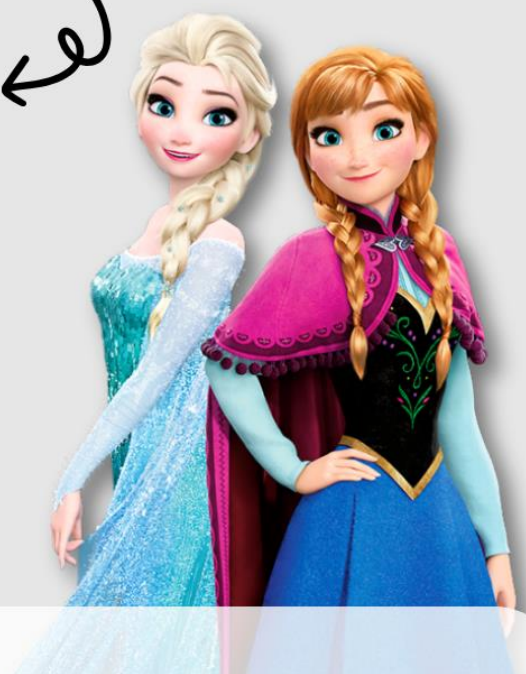
“MOMENTOUS” มหึศจรรยขแสงสีแห่งราตรี