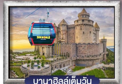
บาน่าฮิลล์เต็มวัน