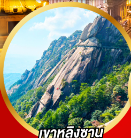
เวาหลิงซาน