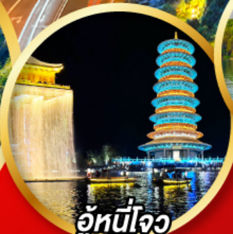
อู่หนี่โจว