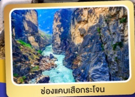
ช่องแคบเสื่อกระโจน

เมนูพิเศษ ! สุกีปลาแซลมอน สุกีเห็ด อาหารกวางตุ้ง