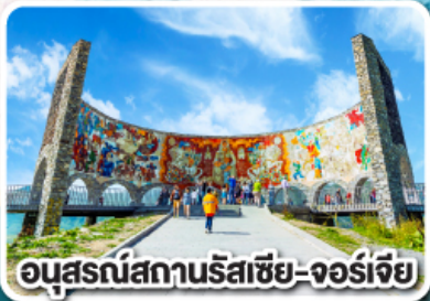
อนุสรณ์สถานรัสเซีย-จอร์เจีย