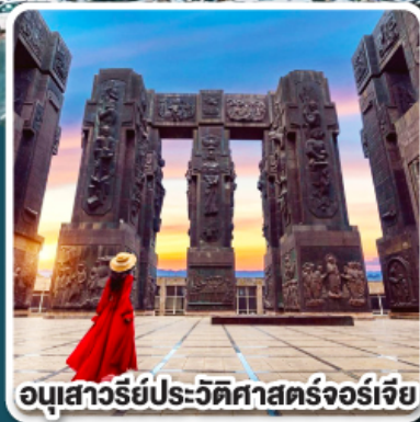
อนุสาวรีย์ประวัติศาสตร์จอร์เจีย

การ์นต์ ห้องพักรีวิวเทือกเขาคอเคซัส ที่โรงแรม ROOMS