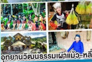
อุทยานวัฒนธรรมเผ่าแม้ว-หลี