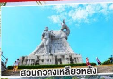
สวนกวางเหลียวหลิ่ง