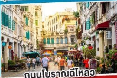
ถนนโบราณอีไหลว