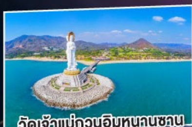
วัดเจ้าแม่กวนอิมหนานซาน