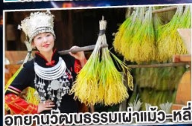
อุทยานวัฒนธรรมเผ่าแม้ว-หลี