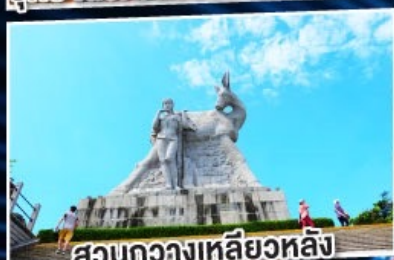
สวนกว้างหลิวหลัง