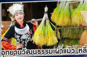
อุทยานวัฒนธรรมเผ่าแม้ว-หลี่