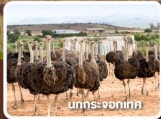
บกระทระจอกเทศ