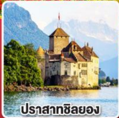
ปราสาทซิลยง