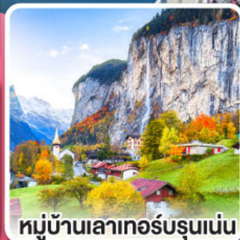
หมู่บ้านเลาเทอร์บรุนเนน